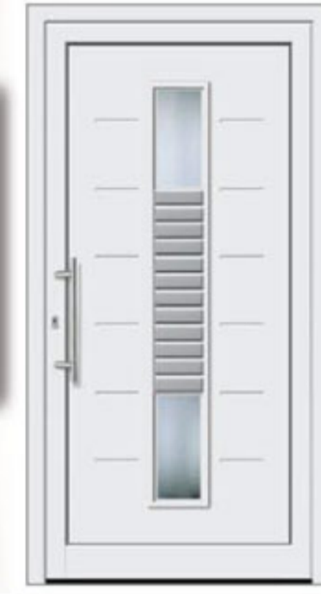
Modell 511 • Glas Orna C weiß • Griff: EAS 500 • Edelstahlapplikationen außen