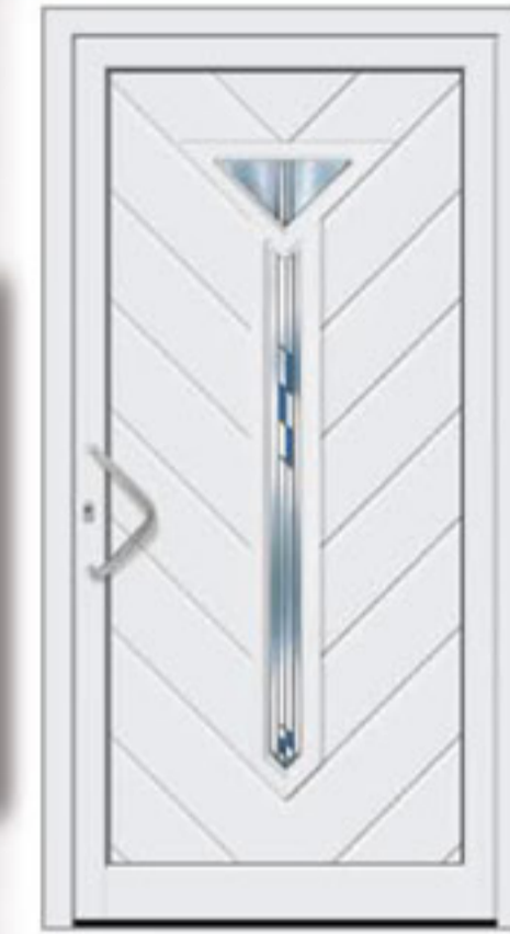
Modell 507 • Glas: Motivverglasung • Griff: EA 603