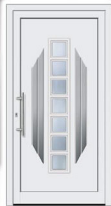
Modell 509 • Glas Orna C weiß • Griff: EAS 500 • Edelstahlapplikationen außen