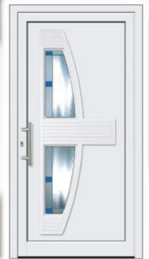
Modell 508 • Glas: Motivverglasung • Griff: EAS 400