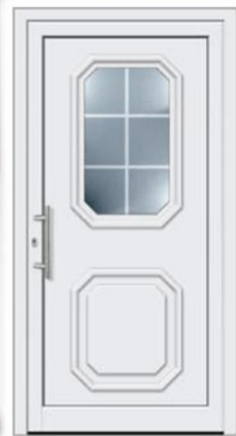
Modell 505 • Glas: Orna C weiß • Griff: EAS 400