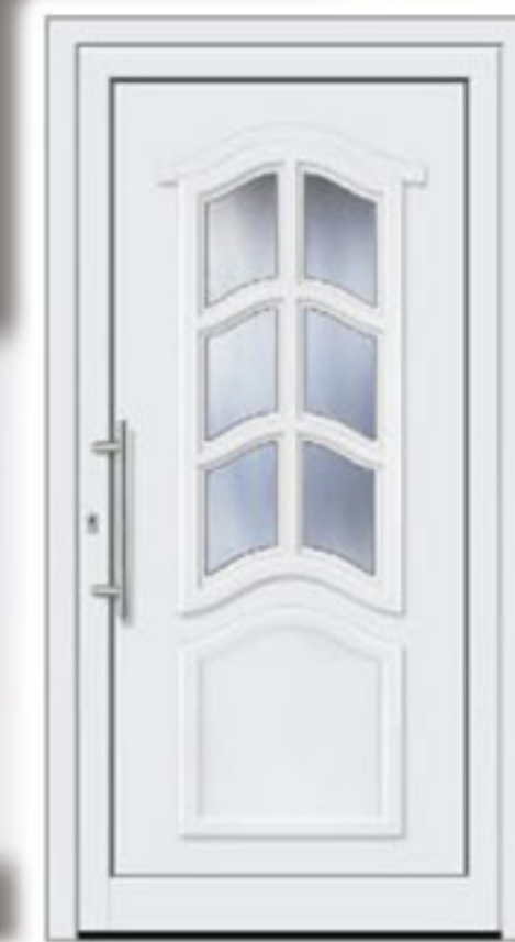
Modell 506 • Glas: Orna C weiß • Griff: EAS 500