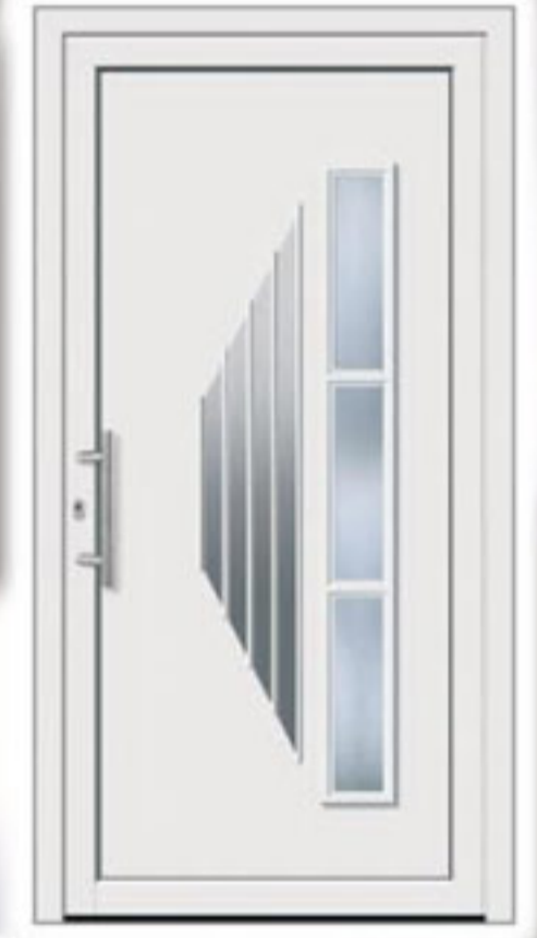
Modell 512 • Glas Orna C weiß • Griff: EAS 400 • Edelstahlapplikationen außen